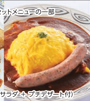
蔵王山麓たまごとウィンナーのトリオ