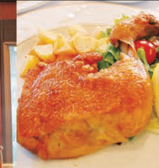
丸森産あか鶏使用