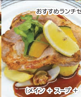
蔵王産豚ロース肉を使用