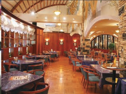
レストラン 120 席完備