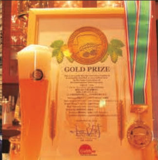
インターナショナル・ビアカップ各種受賞