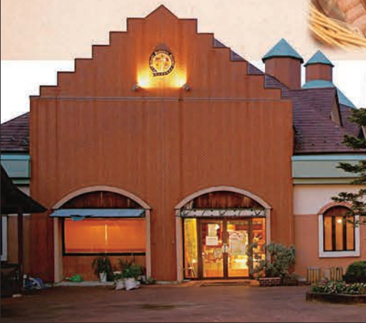
屋外テントガーデンバーベQ