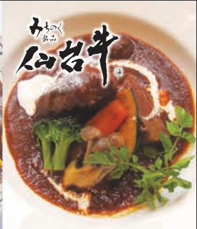
柔らかく煮込みました