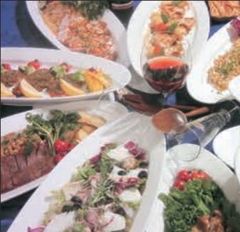
各種プラン承っております